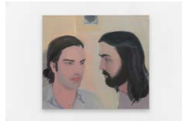
程心怡《或许会是一连串的亲吻》(Maybe a flurry of kisses, 2017)

目前生活在荷兰阿姆斯特丹的程心怡是近年在海外颇受关注的中国女性画家之一。她的绘画作品大部分基于白人男性的肖像，擅长用颜色去诠释人类的情感。然而，她并不希望自己的创作依附在女性主义的讨论中，通过描绘“美丽的有毛发的身体”，她探勘着情感、欲望与权利的浮动关系。今年 6 月，程心怡于巴黎 Balice Hertling 画廊举办了首个画廊个展“The hands of a barber, they give in”，展出了 17 件创作于 2016 及 2017 年的近作；10 月，天线空间又于伦敦弗里兹博览会推出了她的个人项目，呈现了她在阿姆斯特丹参与荷兰皇家视觉艺术学院 (Rijksakademie) 驻留项目期间完成的 7 张油画作品。此外，这位年轻艺术家还在今年 10 月收获了她的第一次美术馆收藏——《第二个吻》(the Second Kiss, 2017) 以及《或许会是一连串的亲吻》(Maybe a flurry of kisses, 2017) 被洛杉矶的哈默博物馆 (Hammer Museum) 藏购。2018 年夏天，程心怡将在天线空间举办她在中国的首次个展，总体性地展现其近年来的创作，目前正为此次筹划新作。除了绘画之外，她也正对过去五年的摄影作品进行梳理，计划在明年展出。值得一提的是，艺术家在整理摄影作品的过程中，于画面的接叙中，发觉了自己对录像艺术的兴趣，而这可能会成为她的新创作方向。