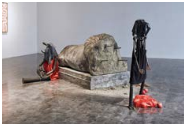
阿贾伊·库里安《梦想家》(The Dreamers), 2016

阿贾伊·库里安十分厌恶迪斯尼电影《头脑特工队》。他问道，为什么有人想让自己的孩子了解成长的过程以及官僚主义的白领生活？库里安在 2017 年获得了相当充分的曝光，他的装置作品《孩子群》参加了惠特尼双年展：在贯穿整个惠特尼博物馆的楼梯天井中悬挂的绳子上有十几个孩童大小的雕塑人物爬上爬下。这件作品如此受欢迎，以致虽然在写这篇文章的时候双年展已经结束了，但作品的大部分还挂在那里。库里安的作品着眼的一些文化问题虽然都不大，却定义了如今当代生活的肌理。例如，出现在看似中立的卡通动物空间里的种族、性别和阶级属性。库里安既是理论家又是艺术家，他找到了一种方法来调和后互联网思维与政治的、后殖民主义的图像产生过程之间的关系，而在过去的一年中，政治身份和后殖民主义死灰复燃并且愈演愈烈。继 2017 年在上海举办了展览之后，库里安将于 2018 年在杜塞尔多夫和科隆举办展览，他那些关于美国的衰落和人格观念的变化的作品备受期待。