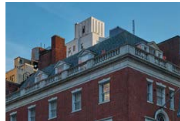
Lévy Gorvy 画廊纽约外景