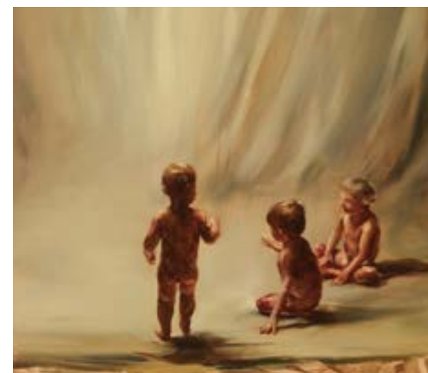
Michaël Borremans 作品《来自太阳的火焰》(Fire from the Sun, 2017)，将于香港卓纳画廊开幕时展出