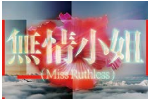
“寻找无情小姐” (In Search of Miss Ruthless) 展览海报