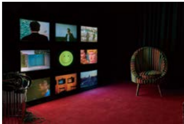
“光影的解析” (Dream-atic) 展览现场, Christian Louboutin, 2017

于 2017 年年末刚刚结束在刘韡工作室三年任职的策展人、写作者李博文，在过去一年中逐渐以“独立”的身份走入大家的视线。其中，最值得关注的动向之一，即是其与艺术家孙诗共同创办的艺术空间 Wyoming Project。这一深藏在北京后永康胡同的 30 平米空间，开幕呈现了年轻艺术家陈陈的个展“可能宝宝” (possible baby)，展出了一件供 (观众) 玩家与艺术家的虚拟后代相互互动的电子游戏。同时，他还为上海 J: GALLERY 策划了双人展 “All The Single Ladies” (2017 年 7 月 29 日 ~ 9 月 8 日，展出了艺术家郭城、沈翰的作品)；并为素以“红底鞋”著称的法国高跟鞋品牌 Christian Louboutin 位于北京三里屯北区的艺术空间策划了群展“光影的解析” (Dream-atic)。尽管如此，李博文并不希望将自己限定在“策展人”这个身份框架之内，而试图在策展这样一个牵涉多方的工作形态中去构建一种脱离行业既成建制的动态、开放的关系。因此，在 Wyoming Project 的运作中，他将更多地试图将自己放在创办人的角色，邀请艺术家来一同筹划命题。从特纳奖得主到出生于 1990 年代的一批中国最年轻的艺术家加入 2018 年的展览计划中。此外，写作是李博文的艺术实践中的重要部分，在新的一年里，他会将更多的精力投入其中；而 Wyoming Project 的每个项目，皆会推出相关的出版物，开幕展的同名书籍《possible baby》将于 2018 年初面世。