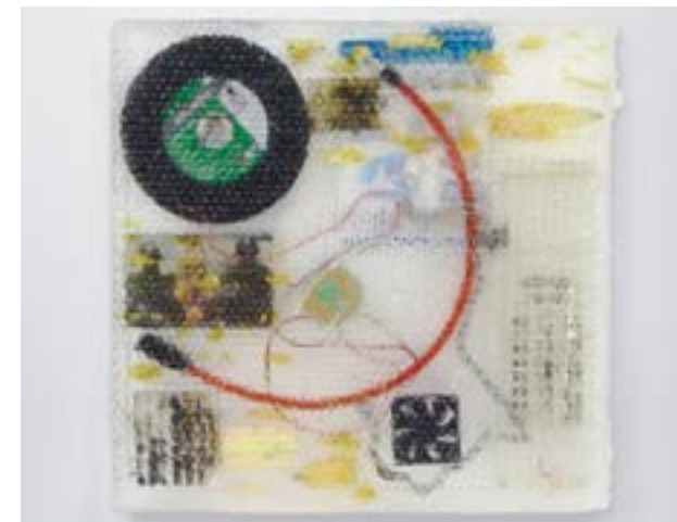
陆浩明《Catalyst Kit No. 3》，2017

陆浩明是新一代香港艺术家的一员，他们摒弃了诸如李杰、白双全、杨嘉辉等世界知名的前辈的谦逊、敏锐、温柔、积极的美德，更专注于物质性、建构、破坏和张力。2017 年陆浩明在黄竹坑德萨画廊 (De Sarthe Gallery) 的个展真正确定了他的地位，他花了好几个月的时间处理画廊空间，拆掉了地板，利用其他艺术家工作室抛弃的东西搭建了一个相当粗鄙的攀岩墙。他是一个“熵”艺术家，擅长从混乱中创造出新的体系，使之加速变化并且最终激烈燃烧。现在他刚刚签约了画廊代理，他的作品将越来越多地出现在更多地方的多种平台上，包括 2017 年末和 2018 年的艺术博览会。在 2018 年的香港巴塞艺术博会上，他将会有大型的装置新作展出。在香港这样一个沉浸于“错失感”、感叹自身消失的地方，陆浩明正在围绕衰变寻找表现方式。打破这种模式只会对香港有利，似乎陆浩明正在试图完整呈现他所选择的城市的另一面。